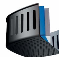
ANTIADERENTE BLACK RESIST + DURABILIDADE + SAÚDE