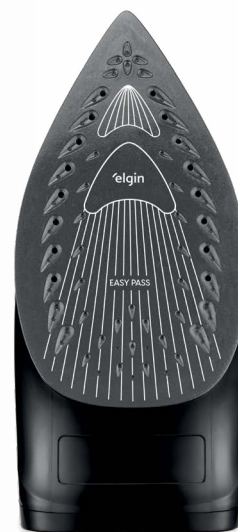
BASE ANTIADERENTE EASY PASS