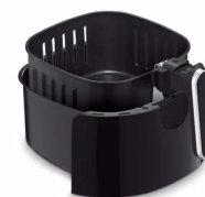
CESTO QUADRADO REMOVÍVEL