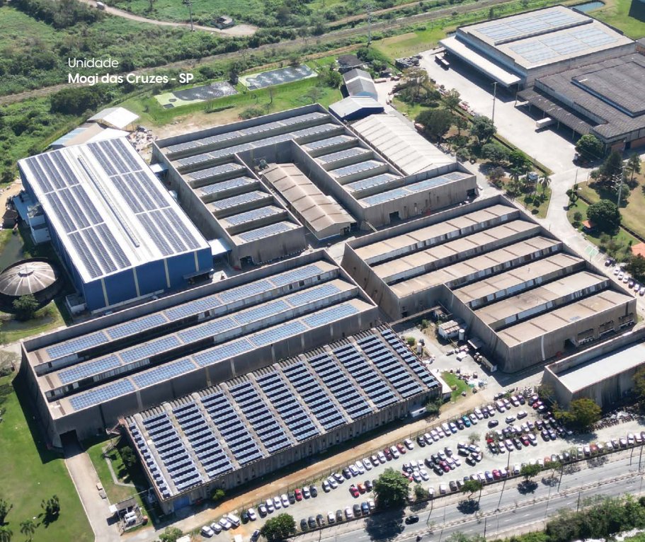
Unidade Mogi das Cruzes - SP